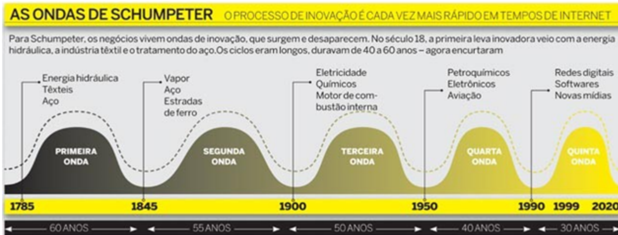
Figura 2 - As ondas de Schumpeter – O processo de inovação.